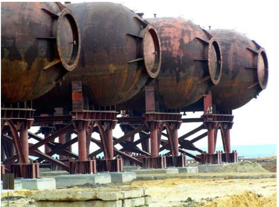
Емкости установлены на свое рабочее место