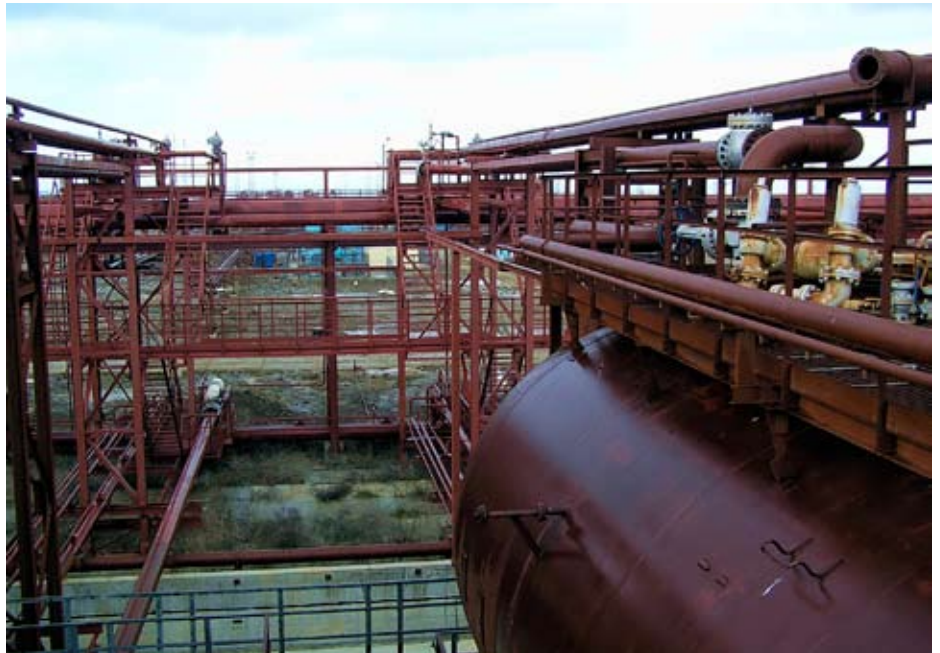
Емкости в завершающей стадии монтажа перед покраской

У истоков реанимации проекта Таманского перегрузочного комплекса в части сжиженных углеводородных газов была фирма «Монрем»